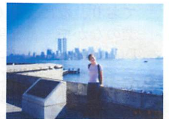
価値観が大きく変わったアメリカ研修。

2年の夏休みに、1ヵ月半のアメリカ海外研修に参加しました。初めての海外でしたので、現地で見えるもの、会う人すべてが刺激的で、1ヶ月間みっちり英語を学んだ後、ニューヨーク、サンフランシスコ、フロリダなど10都市ほどを周遊したのですが、その際、搭乗した飛行機で生き生きと仕事をこなす女性スタッフの姿を見たり、立ち寄った空港の国際的な空気に触れるうちに、“将来は航空業界で働きたい”という思いが強まりました。ですから、帰国後は、まるで水を得た魚のように、航空業界を軸に経営学の研究を深めていきましたね。そうした研究の集大成として、卒論では、“航空業界における規制緩和”をテーマに、日本とアメリカの各航空会社の特徴や、それぞれの強み・弱み、業界の歴史などを徹底的に検証しました。この時に得た知識は、現在行っている航空業界セミナーでの講演でも大変役に立っていますし、就職活動の際も大きな武器になったと思います。今、採用する側の立場に立ってみると、合格する人というのは、お会いした瞬間、「この人は受かる!」と感ずることが多いんです。日々努力してきた人は、それがちょっとした表情や言葉に滲み出るのですよね。身だしなみや立ち居振る舞いももちろん大切ですが、本当に重要なのは業界や会社を研究し、「人材に何を求めているのか」をしっかりと見極めて、それに向かって日々努力することだと感ずます。大学時代、それを私に気づかせてくれた仲間と、導いてくれた先生方に、本当に感謝しています。