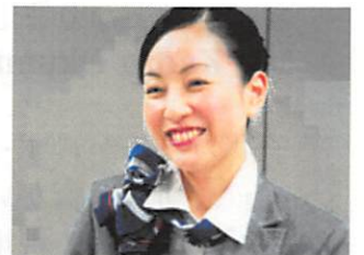
大学は自分の生きる道を探す場所でした。